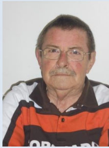
Curiosidades Humberto Lopes

Diz-se Fisco à entidade que nos cobra os impostos. No entanto, Fisco em Roma antiga não era mais que uma canastra. Esta canastra não continha dinheiro mas sim alimentos necessários para o dia a dia. Assim o “Arerius” (canastra) foi atribuída ao imperador, para este retirar uma pequena porção dos impostos cobrados ao povo. Esse valor era-lhe atribuído para os seus gastos particulares. Este cesto particular foi começado a ser chamado pelo povo de Fisco . Logo, Fisco é igual a Cesto Particular .